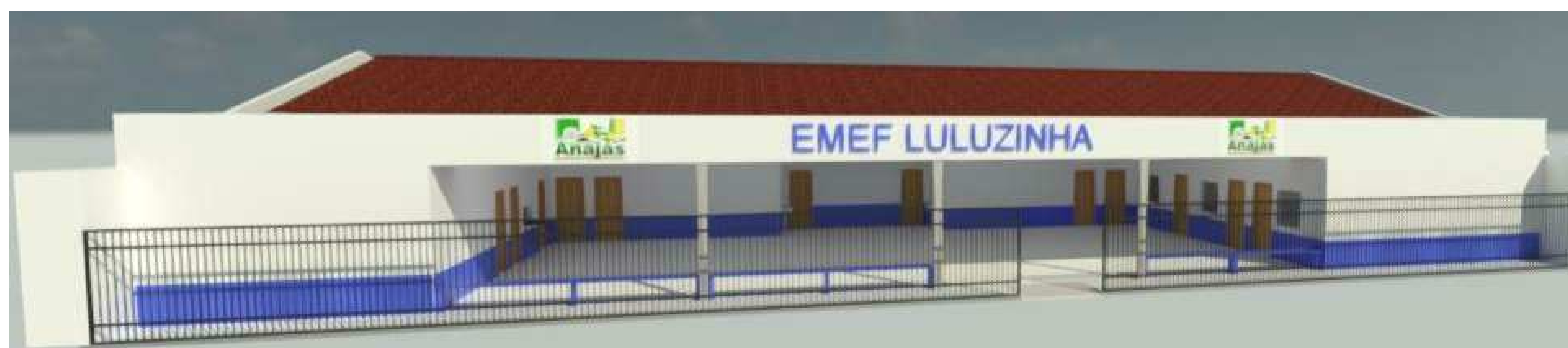
② VISTA FROTA 1 : 1